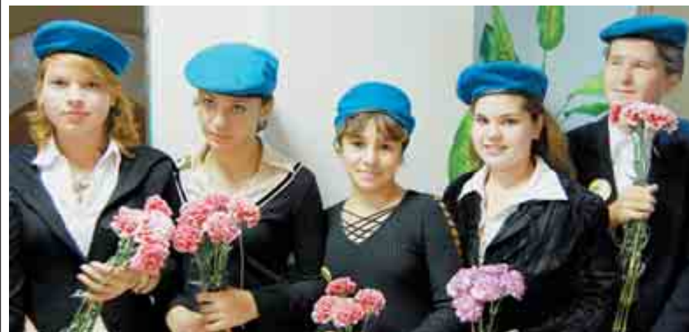
Детская общественная организация «Миротворцы» из школы №462 – активный участник патриотических акций для ветеранов